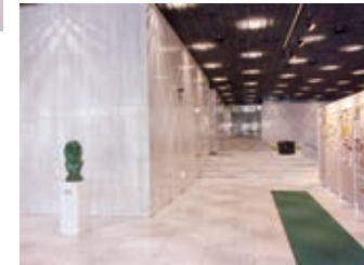
ビルエントランス内部