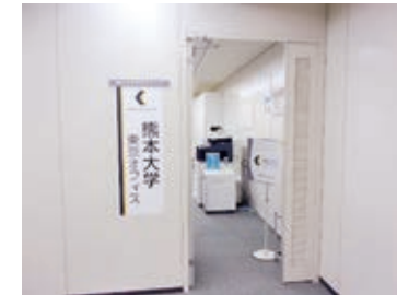
東京オフィス入口

ヘアドライヤー、靴磨きは じめ身だしなみを整える 多量のグッズを自由に使 えます！